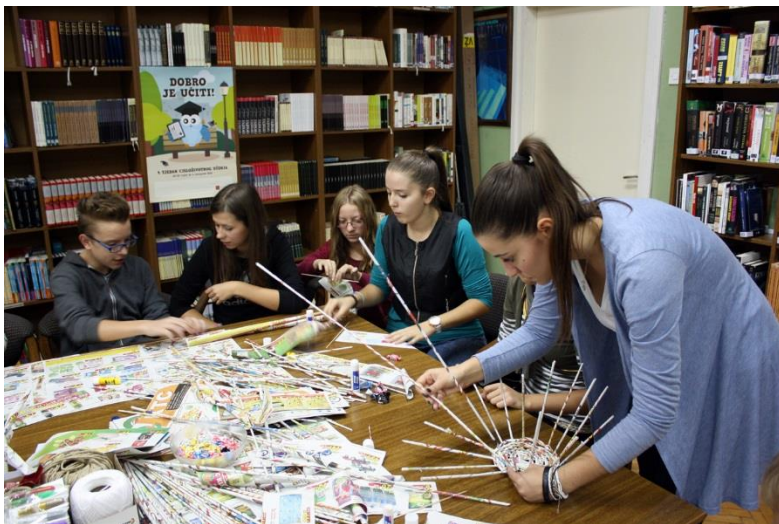
„Pletenje košarica od papira“ radionica Učeničke zadruge „Sunce“ 1. listopada 2015. u 13,00 sati u školskoj knjižnici škole – sudjeluju članice knjižničarske grupe