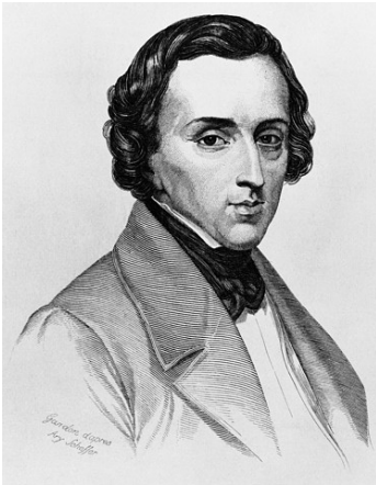
slika 6: Fryderyk Chopin

Rano djetinjstvo proveo je u domovini, a ranu mladost na putovanjima u Berlinu, Beču i Dresdenu. Kao veliki domoljub, trajno se družio s Poljacima u Parizu. Osim manjeg broja orkestralnih i komornih djela, te 17 poljskih pjesama za glas i klavir, Chopin je skladao isključivo djela za glasovir. Chopin je bio jedinstven kao pijanist, izvođač vlastitih djela i sasvim poseban i usamljen kao autor. Bio je bez uzora u prijašnjim razdobljima klasične glazbe i gotovo bez nasljednika. Ostavio je opus od 74 tiskana djela koja po svojoj formalnoj strukturi i poetskim obilježjima nemaju premca u europskoj glazbi. Svojom je umjetnošću odlučno djelovao na klavirsku glazbu i interpretativni stil, pa njegov utjecaj dopire i u 20. stoljeće. Umro je od tuberkuloze pluća.