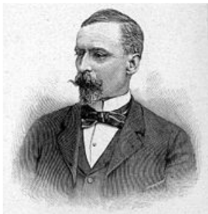
slika 3: Henrik Sienkiewicz