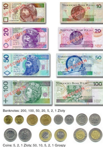
slika 2: zlot, poljska valuta