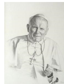
slika 5: Papa Ivan Pavao II.