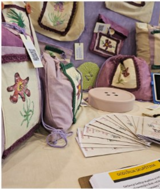
Osnovna škola Vinica ....