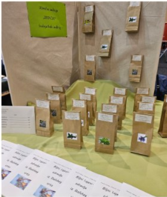
Srednja škola Ludbreg...