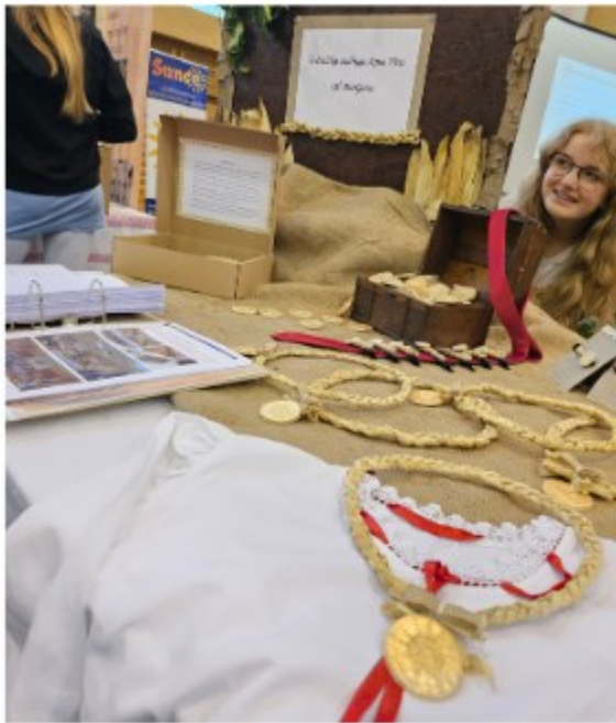
Osnovna škola Petrijanec ...