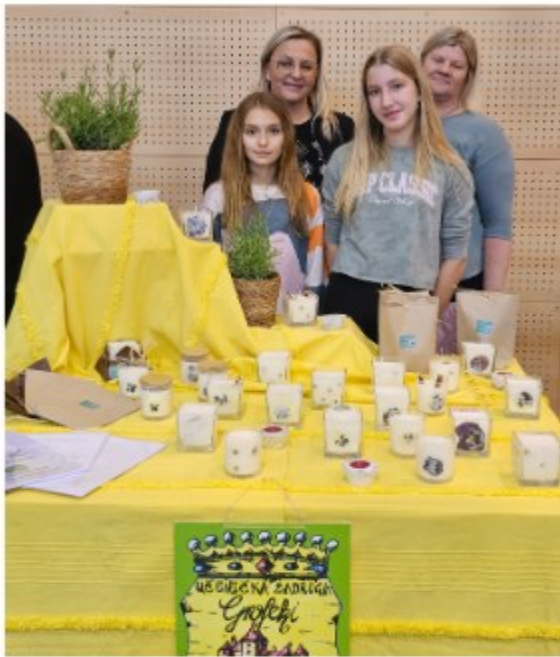
Osnovna škola Bisag ...