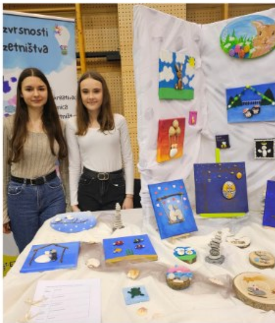
Centar izvrsnosti iz poduzetništva ...