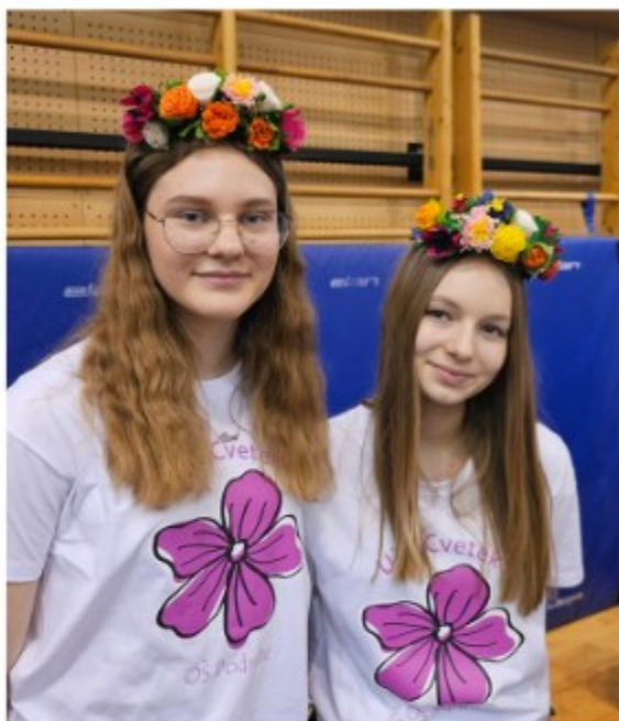
Osnovna škola „Podrute“...