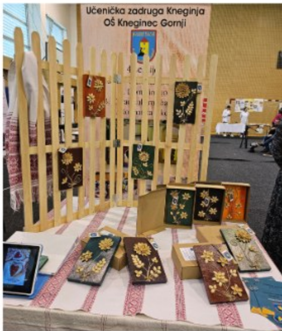
Osnovna škola Knežinec Gornji...