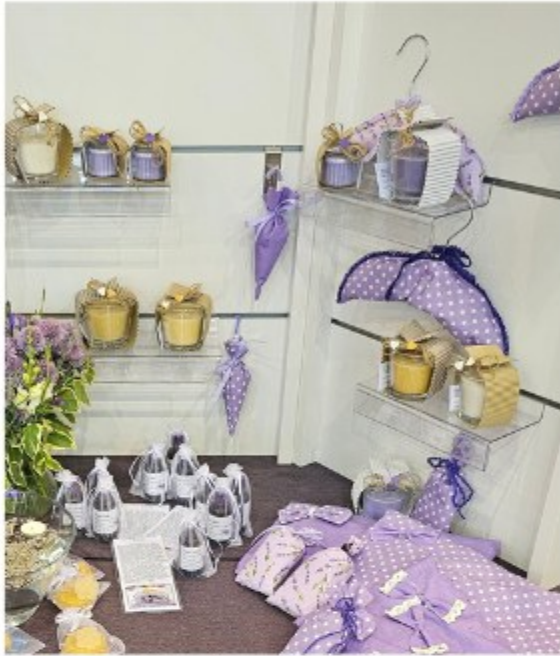
Osnovna škola Vladimira Nazora Sveti Ilija ...