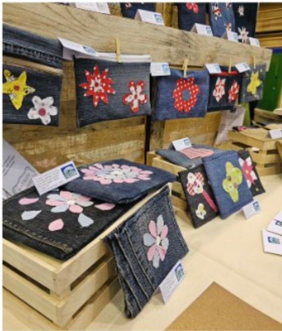
VI. osnovna škola Varaždin....