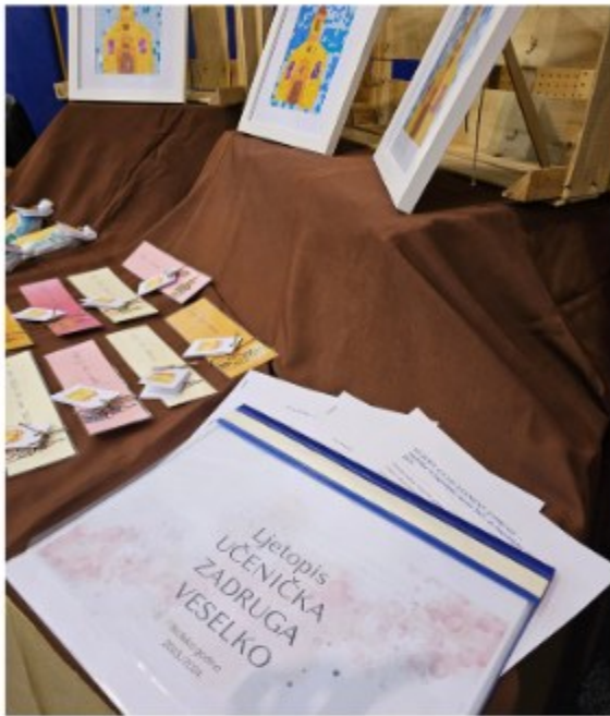
Osnovna škola Tužno ...