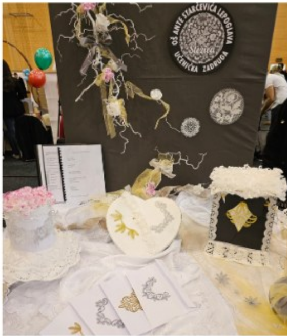
Osnovna škola Ante Starčevića Lepoglava