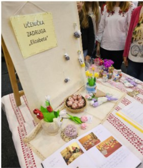
Osnovna škola "Petar Zrinski" Jalžabet