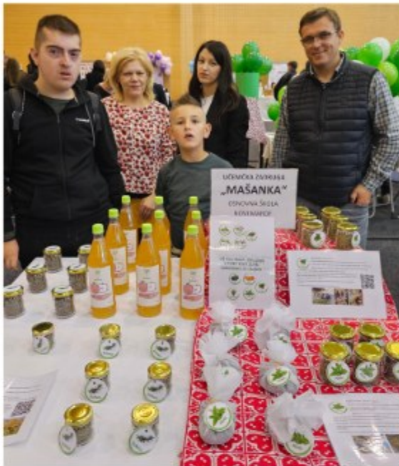
Osnovna škola Novi Marof ...