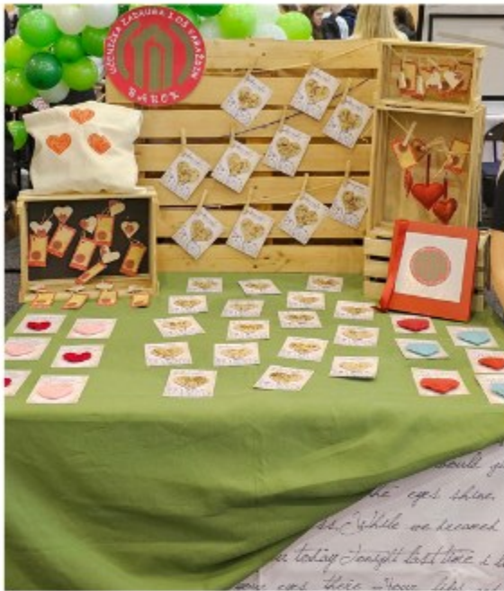
I. osnovna škola Varaždin...