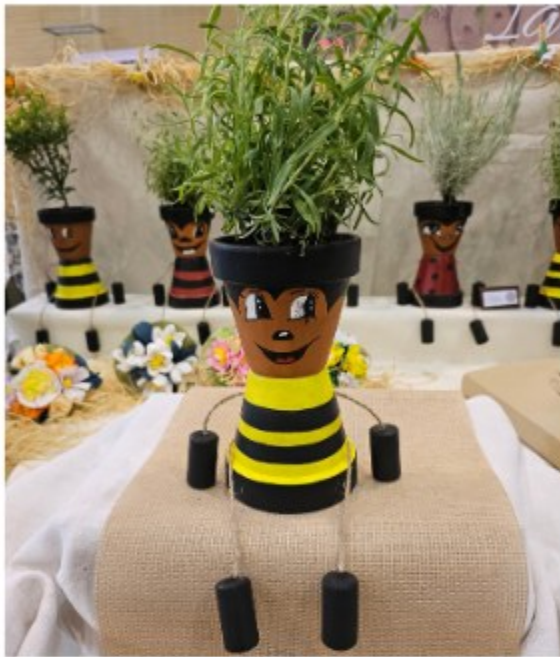
Osnovna škola Metel Ožegović, Radovan...