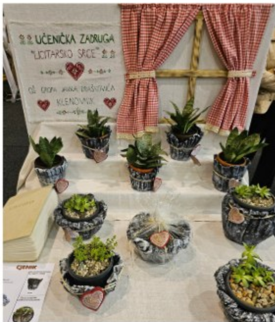
Osnovna škola grofa Janka Draškovića Klenovnik