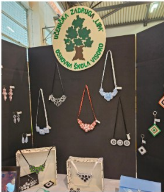
Osnovna škola Visoko ...