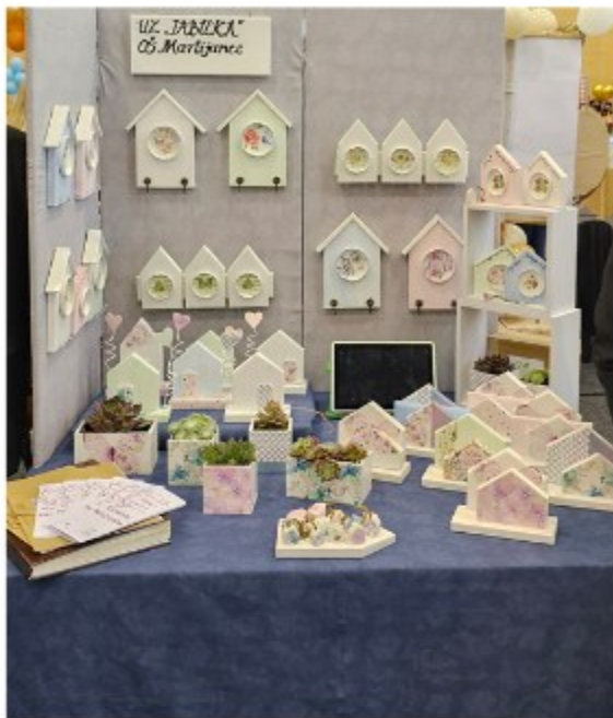
Osnovna škola Martijanec ...