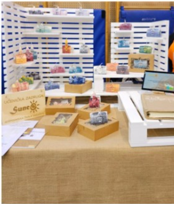
Gospodarska škola Varaždin ...