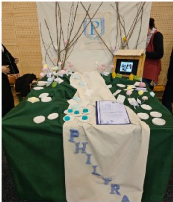
Prva privatna gimnazija s pravom javnosti Varaždin