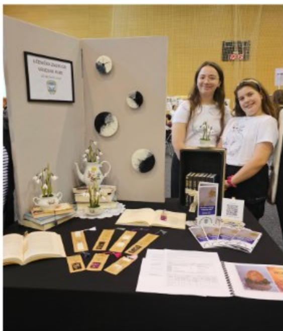
Osnovna škola Breznički Hum ....