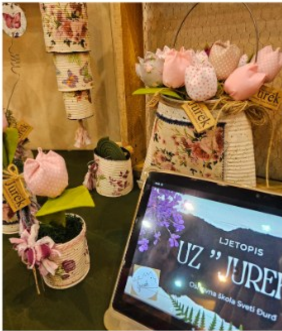
Osnovna škola Sveti Đurđ ...