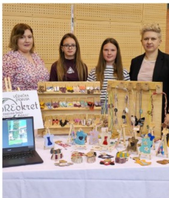
Osnovna škola "Gustav Krklec" Maruševac