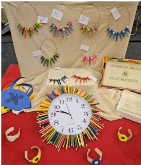
Osnovna škola Veliki Bukovec ...